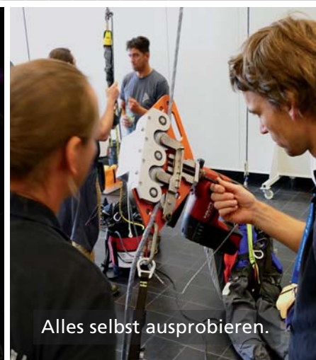
Alles selbst ausprobieren.